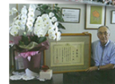
「建設事業関係功労国土交通省大臣表彰」を受賞