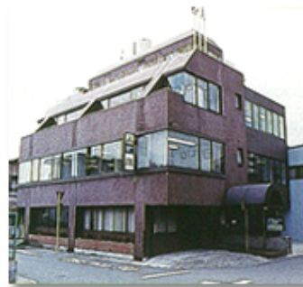
美島ビル (旧本社ビル)